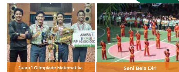
Juara 1 Olimpiade Matematika