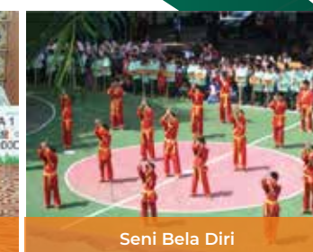
Seni Bela Diri